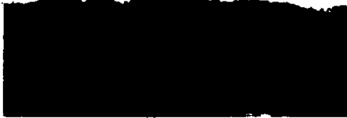
DESDE ESTE CERRO, DONDE SE ENCUENTRAN LAS RUINAS DE "CHITAN", puede observarse toda la población de Melchor de Mencos, incluyendo la carretera. Allí se encuentran instalados planes de artillería del ejército inglés, así como equipos militares. La siguiente fotografía muestra a un soldado guatemalteco, proveniente de Soltes, cruzando la valla de la frontera. Logró escapar al control de vigías.